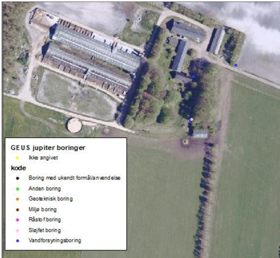
Figur 6. Udsnit af den store fold med placering af vandforsyningsboring (blå prik).

**** I det sydøstligste hjørne af foldarealet grænser foldarealet op til et hedeområde, der er beskyttet efter Naturbeskyttelseslovens § 3. Et fortidsminde på naboarealet afkaster en fortidsmindebeskyttelseslinje der strækker sig mellem 7 - 40 meter ind på nabomatriklen og skaber dermed et "rum" på foldarealet, hvor det ikke er muligt at opsætte hytter/flytbare vogne, fodersiloer, drikkevandsinstallationer eller etablere sølehuller. Dette faktum sammen med tilstedeværelsen af et naturligt læhegn mellem hedeområdet og folden gør, at Vejen Kommune vurderer, at heden er tilstrækkelig beskyttet mod evt. overfladeafstrømning med kvælstofholdigt overfladevand fra foldarealet.