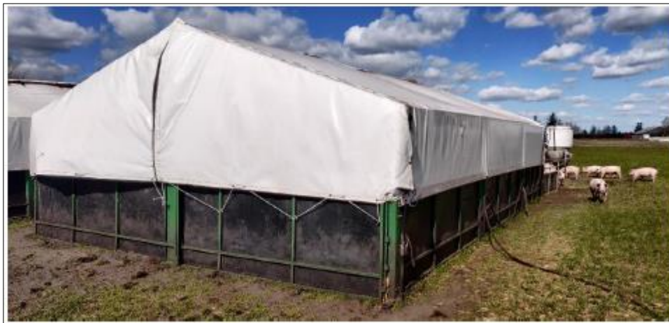
Figur 2. Udformning af de flytbare hytter.

Udformningen af de flytbare hytter og fodersiloer er vist nedenfor.