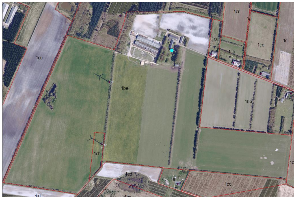
Figur 1b. Samme arealer som i figur 1a, men uden skravering.

Efter det oplyste drives landbrugserhvervsejendommen Høghøjvej 10, 6622 Bække i dag med produktion af søer, smågrise og slagtegrise. Der ønskes en produktion af frilandsgrise. Derfor anses