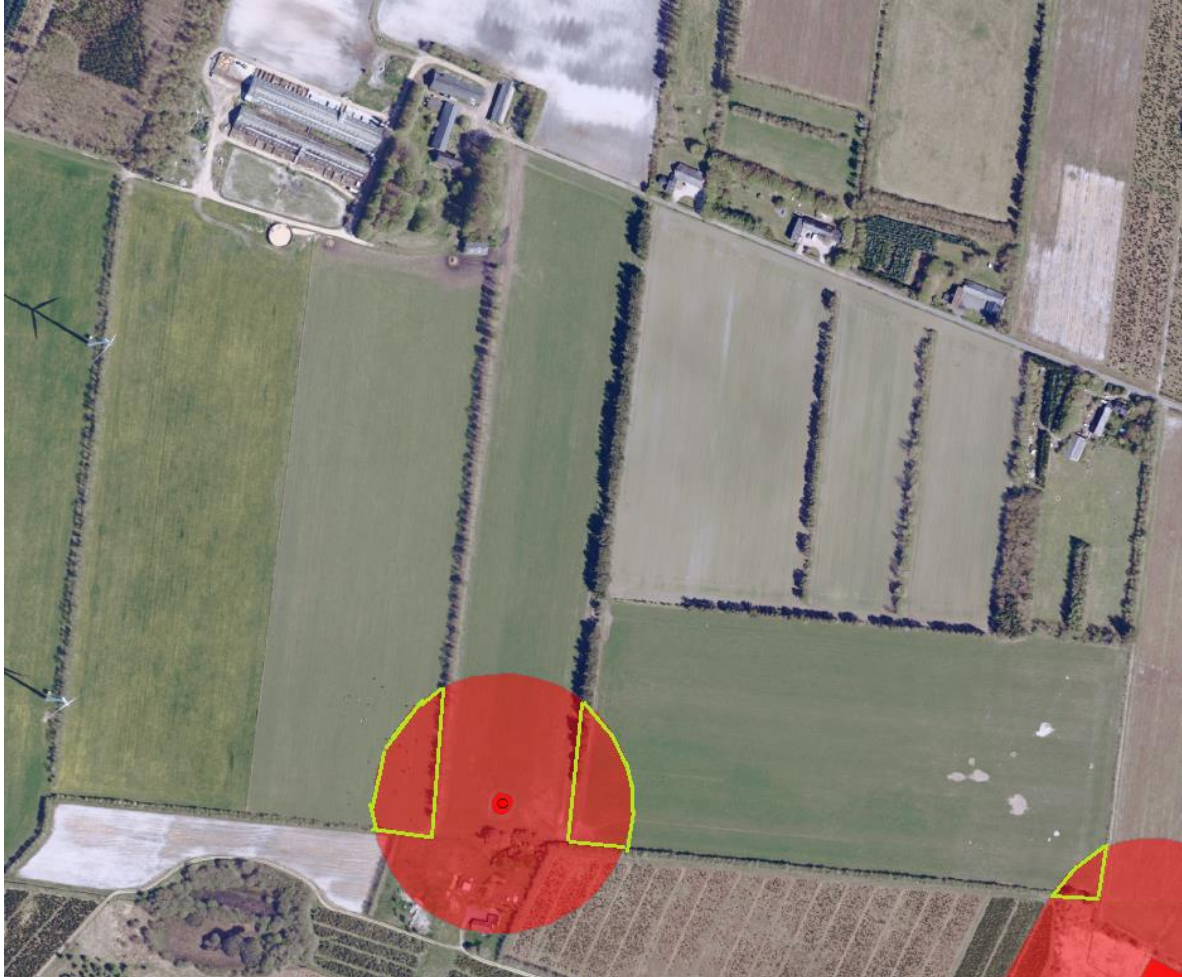
Figur 5. Fortidsmindebeskyttelseslinjer.

Tre "hjørner" af foldarealet er omfattet af "Fortidsmindebeskyttelseslinjen". Indenfor fortidsmindebeskyttelseslinjen (rød cirkel) må der ikke opstilles hytter/flytbare vogne, fodersiloer, drikkevandsinstallationer eller etableres sølehuller til grisene. Det opstillede hegn må ikke afvige i karakter fra et "almindeligt hegn" til dyr, dvs. en eller flere glatte strømeførende tråde og et stormasket fårehegn, der ikke overstiger 1 meter i højden. På dele af marken er der derfor forbud mod opstilling af materiel (hytter/flytbare vogne, fodersiloer og drikkevandsinstallationer) eller jordbearbejdning (etablering af sølehuller). Se figuren herunder.