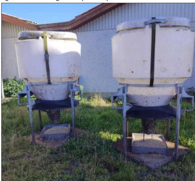
Figur 3. Udformning af de flytbare fodersiloer.